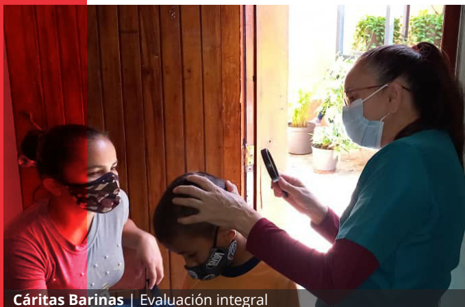
Cáritas Barinas | Evaluación integral

Los profesionales reportaron un segundo diagnóstico en 16% de las consultas totalizando 119.253. Los pacientes recibieron atención específica, educación sanitaria y, en muchos casos,