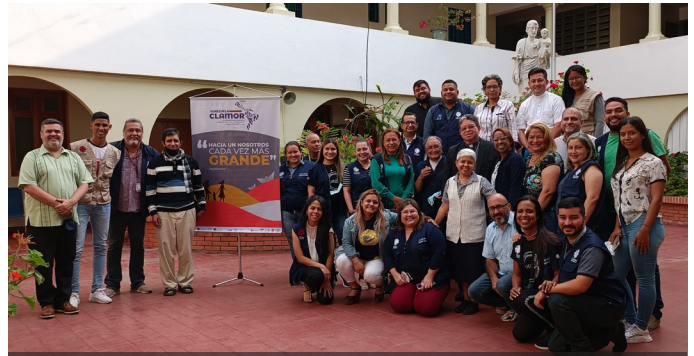
Cáritas Venezuela | Asamblea Red CLAMOR Venezuela (Abril 2022)

Cáritas, por su cobertura y atención integral, ha sido pieza clave para la constitución y fortalecimiento del capítulo nacional de la Red Clamor , que es un espacio de comunión, sinodalidad y articulación de las obras de la Iglesia en Venezuela destinadas a acoger, proteger, promover e integrar a las personas en situación de movilidad.