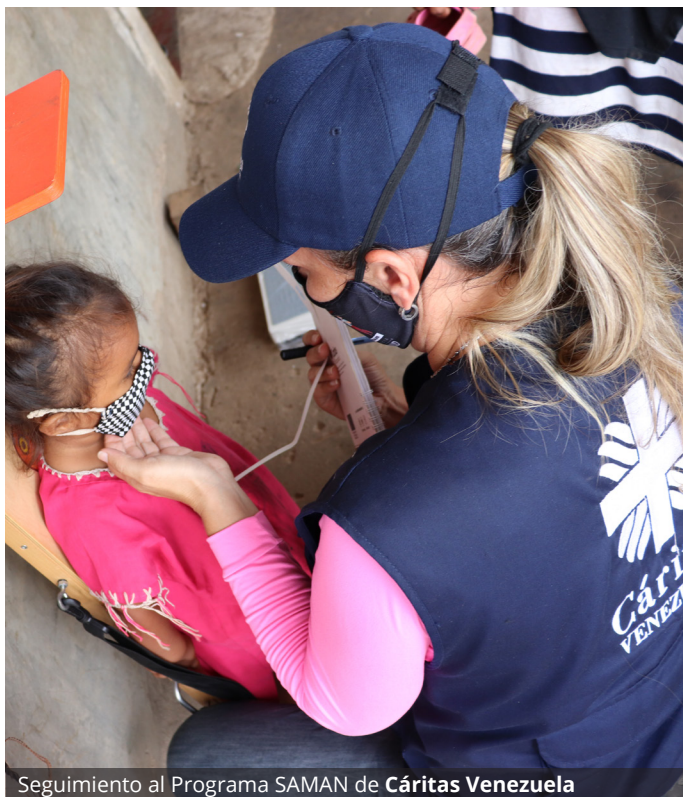
Seguimiento al Programa SAMAN de Cáritas Venezuela