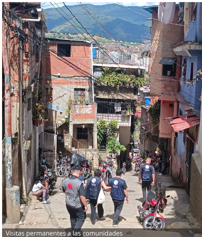
Visitas permanentes a las comunidades

• Continuar expandiendo y consolidando sus Programas bandera SAMÁN –en sus componentes de salud y nutrición- y TENGO. La digitalización de datos para la georreferenciación es un propósito para el nuevo año.