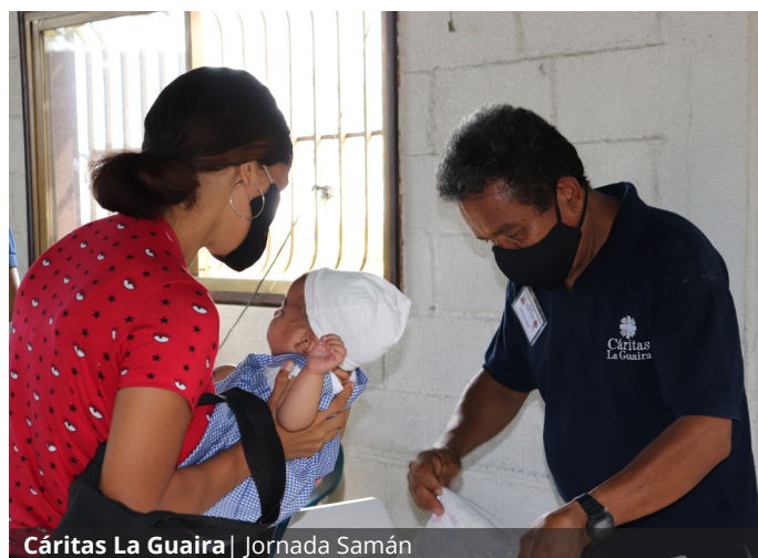
Cáritas La Guaira | Jornada Samán

El sistema de monitoreo de desnutrición en menores de 5 años a través del Programa Samán, también reveló una mejora de la situación nutricional hasta mediados de año. Sin embargo, la prevalencia de desnutrición aguda grave en niños continúa en niveles consistentes con una crisis de salud pública en las parroquias evaluadas por Cáritas.