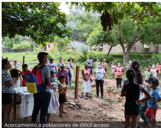
Acercamiento a poblaciones de difícil acceso

En 2023 Cáritas se compromete también a continuar fortaleciendo sus capacidades en temas de protección, salvaguarda