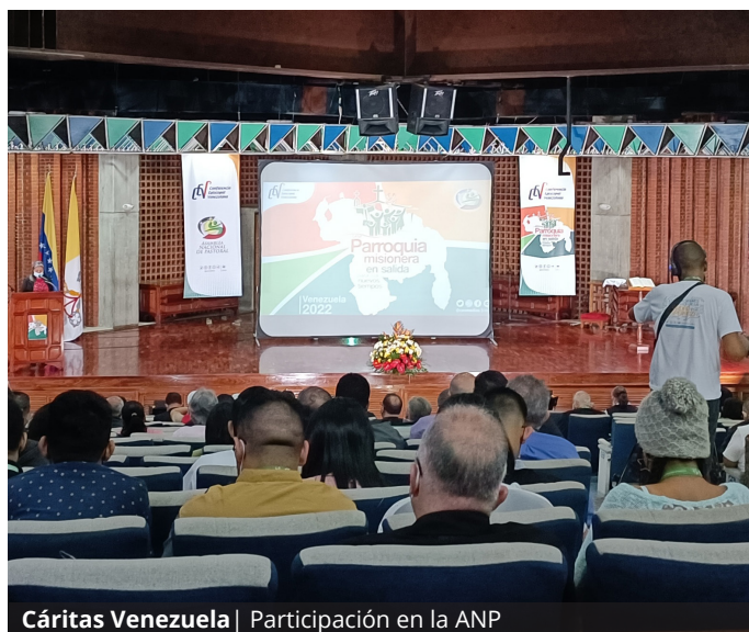
Cáritas Venezuela | Participación en la ANP