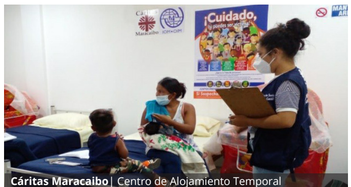
Cáritas Maracaibo | Centro de Alojamiento Temporal

El 70% de la pastoral de movilidad humana que anima a la Red CLAMOR Venezuela es de Cáritas