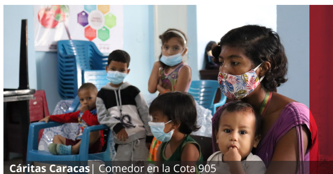
Cáritas Caracas | Comedor en la Cota 905

Otro logro de TENGO en 2022 fue el incremento a 80 en el número de establecimientos comerciales con los que se suscribió convenio de ejecución. El convenio incluye el compromiso de velar por la inocuidad de los alimentos, la confidencialidad de los beneficiarios y otros aspectos relacionados con la salvaguarda, rendición de cuentas, códigos de ética y conducta de las Cáritas Internationalis.