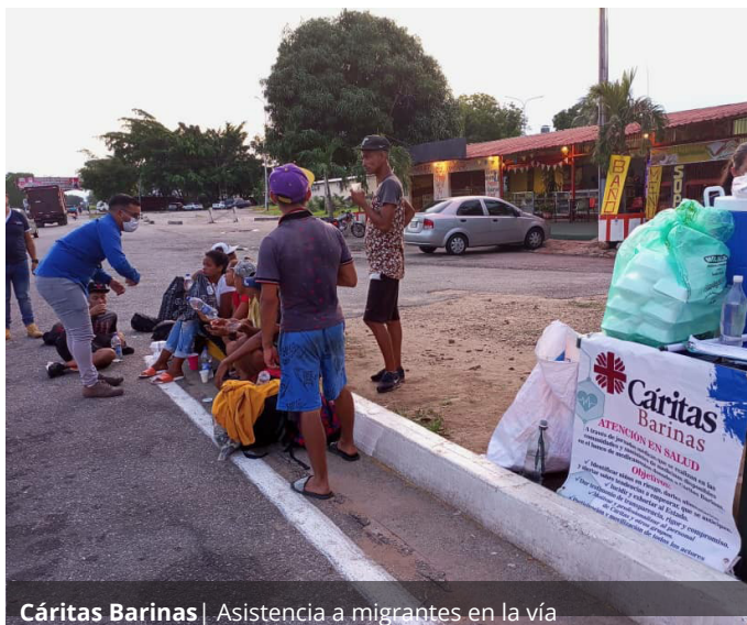
Cáritas Barinas | Asistencia a migrantes en la vía

Allí las personas en situación de movilidad reciben hidratación, alimentación, insumos para la higiene, información y animación para la toma de decisiones sobre la conveniencia o no de emprender la ruta migratoria según sean sus fortalezas y debilidades; para ello se aplica un test de autoevaluación.