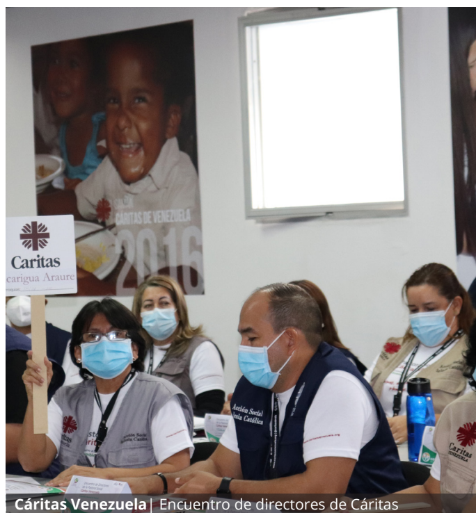
Cáritas Venezuela | Encuentro de directores de Cáritas

• Encuentro de directores de Cáritas, del 6 al 9 de junio de 2022, en Caracas. Participaron 62 personas entre representantes de las distintas arquidiócesis, diócesis y vicariatos apostólicos del país y el equipo nacional. Los objetivos del encuentro los describe su consigna: «Encontrarnos, celebrar y planificar juntos».