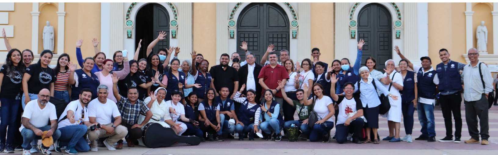
Cáritas Venezuela | Jornada de retiro espiritual previo al encuentro binacional en la frontera colombo venezolana | #SEP2022

Todo servicio al más necesitado en Cáritas va impregnado del compromiso de hacer presente el amor de Cristo y de sembrar la esperanza que nace de la fe en Él y es, por tanto, una acción pastoral. Hay, sin embargo, momentos en los que comunión, anuncio y servicio fraterno confluyen con mayor fuerza haciéndose más evidentes. En 2022 algunos de esos momentos fueron: