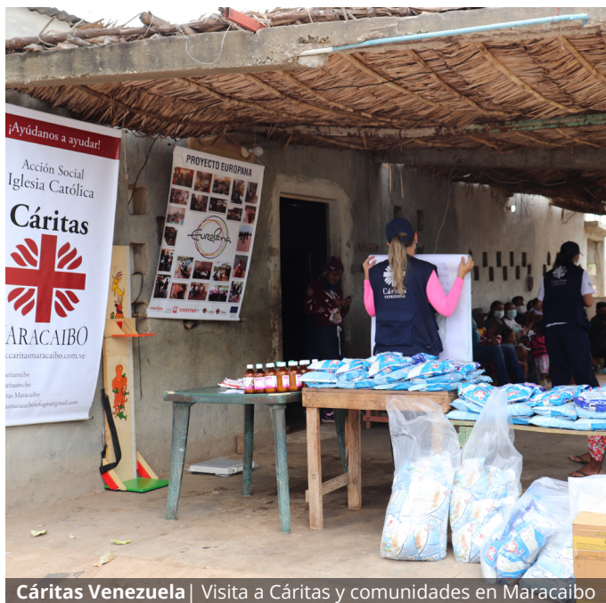
Cáritas Venezuela | Visita a Cáritas y comunidades en Maracaibo