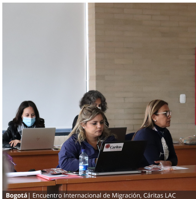
Bogotá | Encuentro Internacional de Migración, Cáritas LAC

• Encuentro Internacional de Migración en el CELAM/ Cáritas de Latinoamérica y el Caribe, del 1 al 5 de agosto 2022, en Bogotá. Se realizaron talleres sobre construcción de paz y resolución de conflictos. Además permitió una aproximación común al contexto migratorio en la Región.