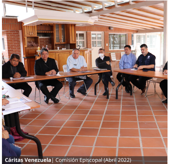
Cáritas Venezuela | Comisión Episcopal (Abril 2022)