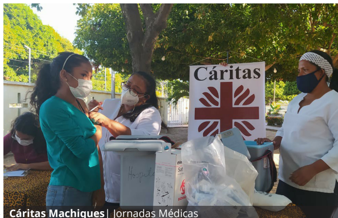
Cáritas Machiques | Jornadas Médicas