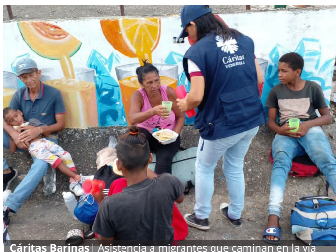
Cáritas Barinas | Asistencia a migrantes que caminan en la vía

Las acciones de servicio concreto en Cáritas incluyen la acogida en 17 Centros de Alojamiento Temporal (CAT) ubicados en los estados Zulia, Falcón, Sucre, Barinas, Apure y Táchira donde, además de hospedaje, los caminantes reciben, alimentación, facilidades para su higiene personal, se les escucha y orienta para que hagan una migración más segura.