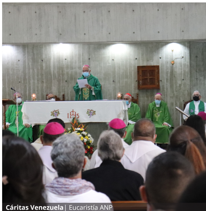
Cáritas Venezuela | Eucaristía ANP