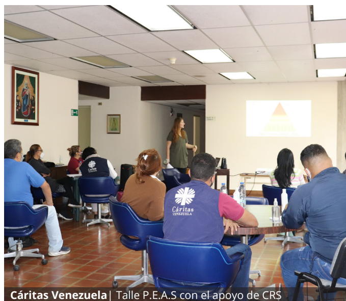
Cáritas Venezuela | Talle P.E.A.S con el apoyo de CRS