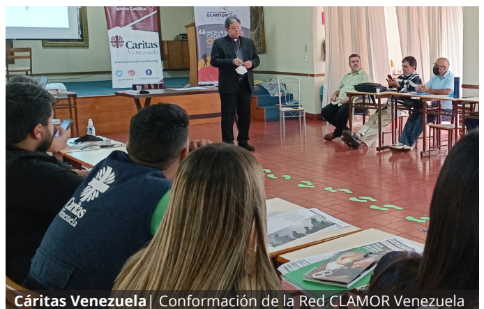
Cáritas Venezuela | Conformación de la Red CLAMOR Venezuela

• Se realizaron encuentros ordinarios con los directores de las Cáritas diocesanas, el