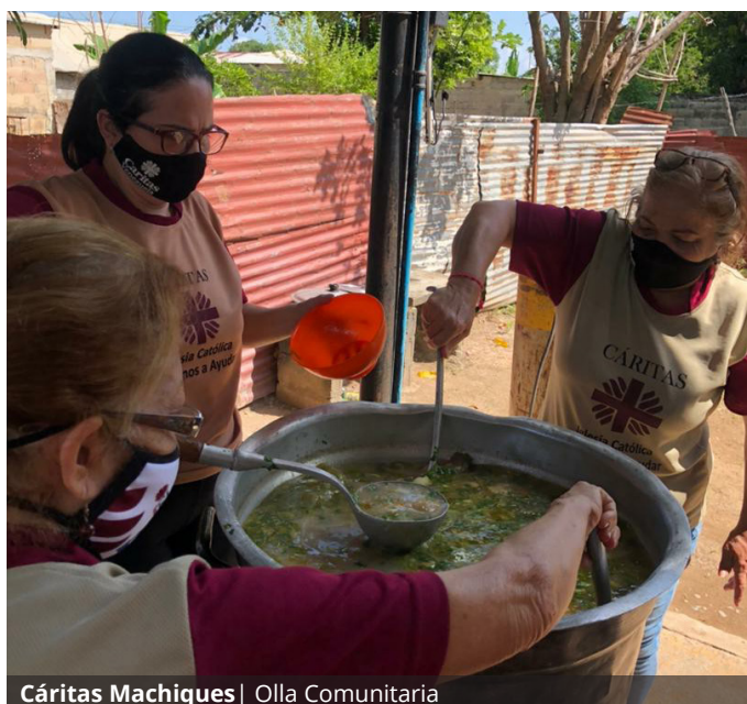
Cáritas Machiques | Olla Comunitaria