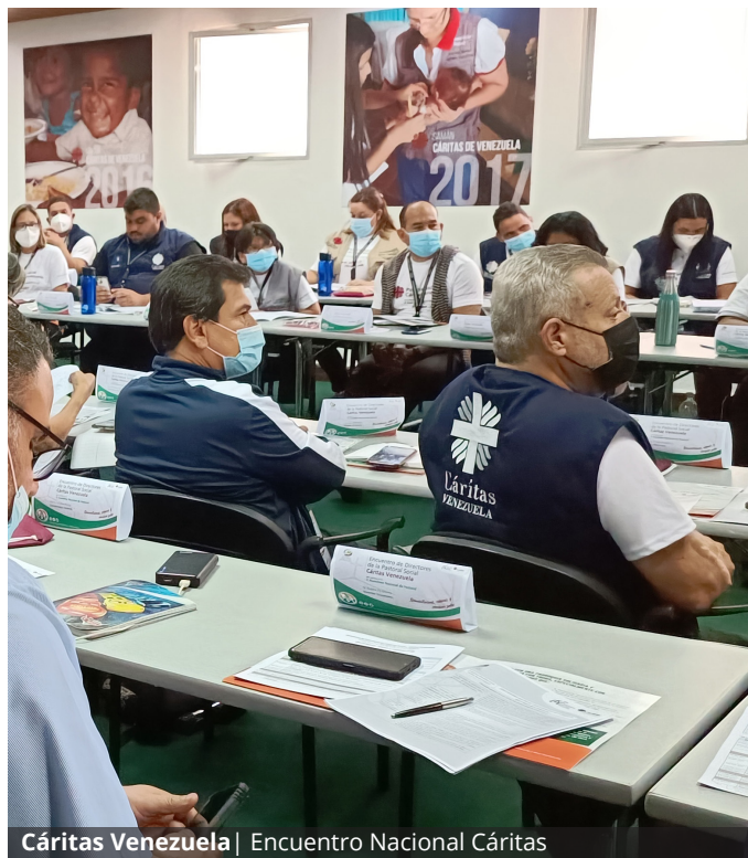
Cáritas Venezuela | Encuentro Nacional Cáritas

Estas propuestas fueron llevadas posteriormente al gran encuentro nacional del mes de julio y, en la fase final de la asamblea, Cáritas siguió prestando servicio a la Iglesia Venezolana formando parte del equipo sistematizador de las conclusiones.