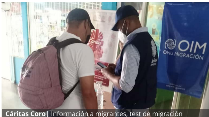
Cáritas Coro | Información a migrantes, test de migración

Complementariamente se entregan insumos a miembros de comunidades de paso o de reinserción que presentan carencias (Kits comunitarios). De todas estas acciones solo en tres casas y 9 puntos móviles se beneficiaron 19.460 personas en 2022, el 56% de ellas fueron niñas, adolescentes y mujeres.