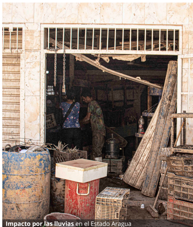
Impacto por las lluvias en el Estado Aragua