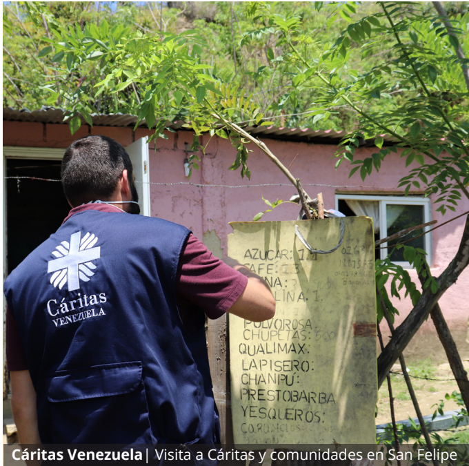
Cáritas Venezuela | Visita a Cáritas y comunidades en San Felipe

equipo nacional, comisiones episcopales y Asambleas de Obispos.